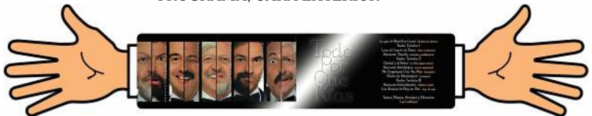
PROGRAMA, CARA INTERIOR

(Habrá que explicar que esta imagen es el programa desplegado, abierto, y que hay que imaginarlo en anverso y reverso, doblado al medio, tal como una revistita)