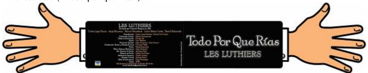
PROGRAMA, CARA EXTERIOR

Tomen algunos programas para decidir qué vamos a poner en el que tenemos que escribir. Fíjense qué información tienen todos, cuál es la que no falta y cuál varía. Miremos este (“Todo por que rías”): :