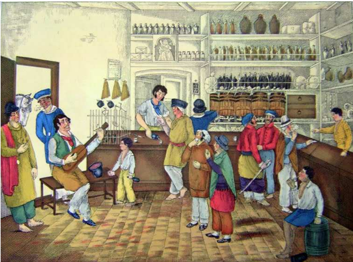
Interior de una Pulpería (litografía coloreada_1834)