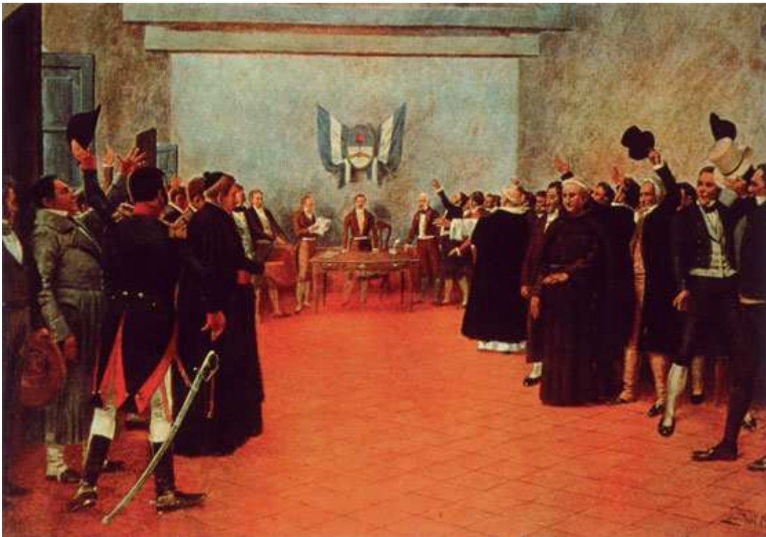
El Congreso de Tucumán 1816-Francisco Fortuny