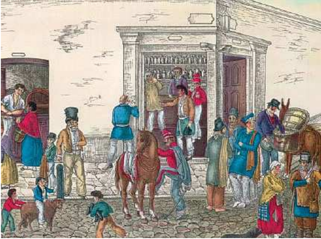
Pulpería de ciudad, litografía de Bacle.