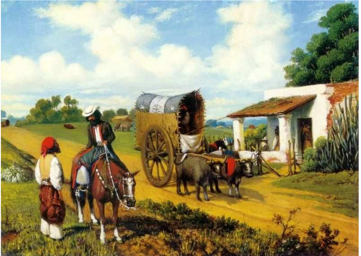
Un alto en la pulpería Prilidiano Pueyrredón (1860) Museo Nacional de Bellas Artes de Buenos Aires