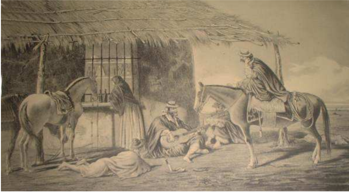
Pulpería del Campo"- Siglo XIX – Grabado Pallière, León, " Escenas Americanas - reproducción de cuadros, acuarelas y bosquejos" - Litografía Pelvinian, Buenos Aires, 1864 Museo Nacional de Bellas Artes.