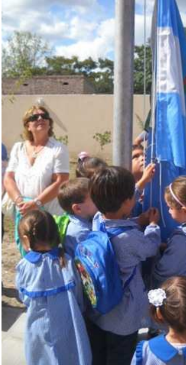
Jardín N°912, Lobos