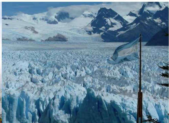
Glaciar Perito Moreno, Calafate, Pcia.de Santa Cruz