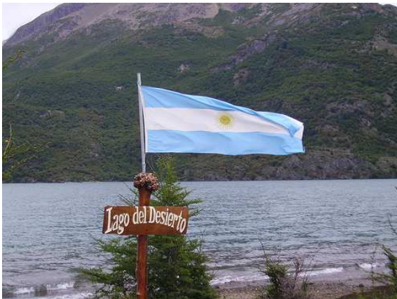
Lago del Desierto. Chaltén. Santa Cruz