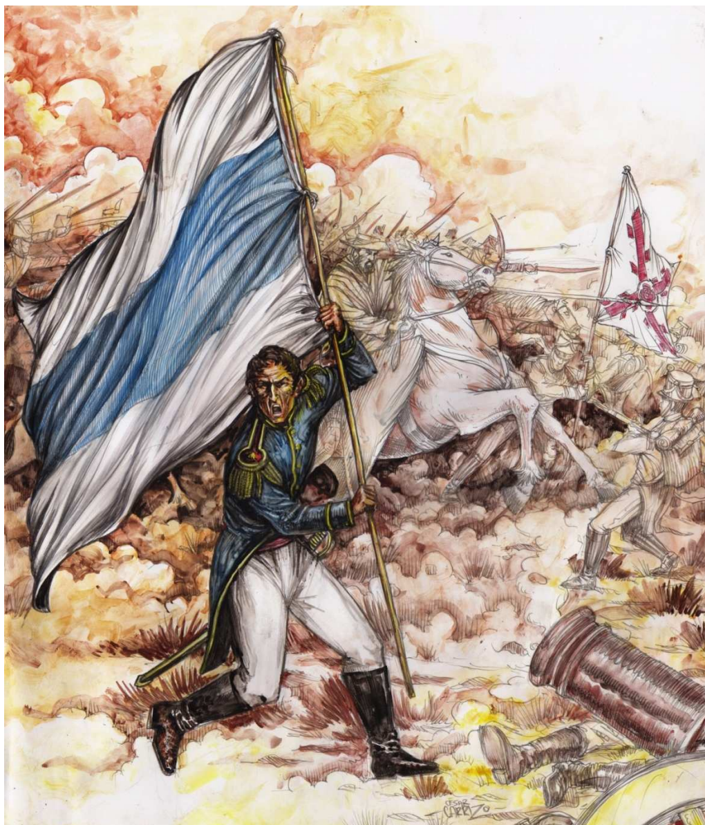
La Bandera de Macha. Óleo César Carrizo