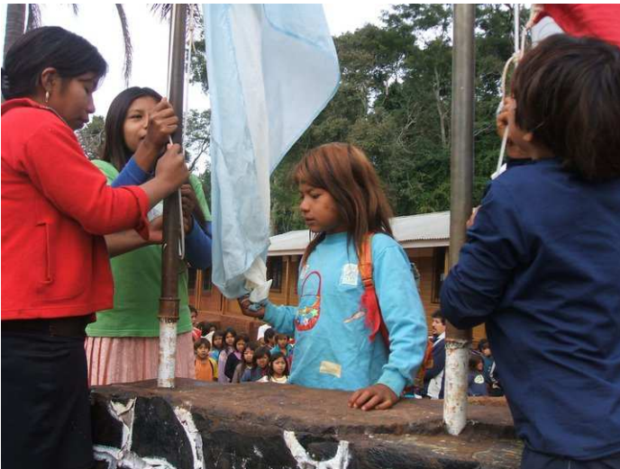
Escuela de frontera Mbororé. Aldea Aborigen-Misiones.