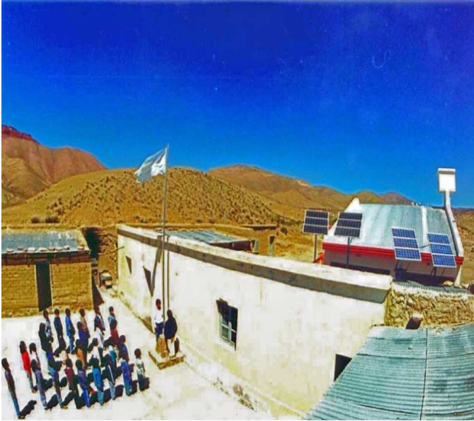
Escuela Rural de San Miguel de Colorados. Pcia de Jujuy