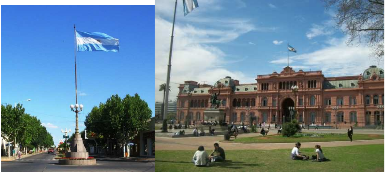
En los Edificios Públicos y Plazas