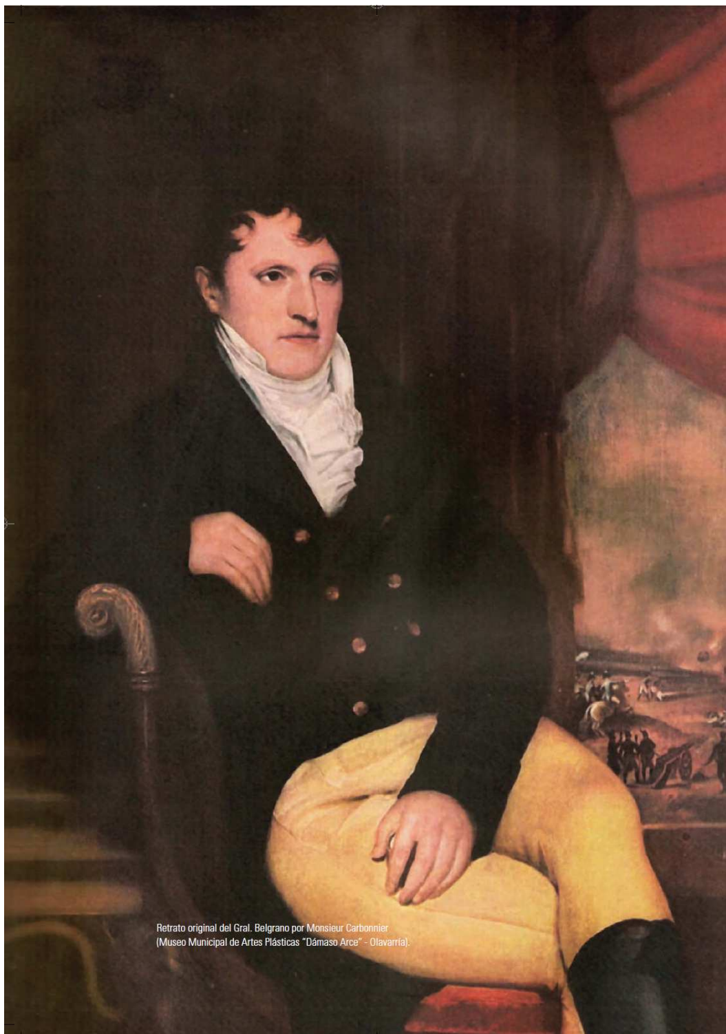
Retrato original del Gral. Belgrano por Monsieur Carbonnier (Museo Municipal de Artes Plásticas "Dámaso Arce" - Olavarría).