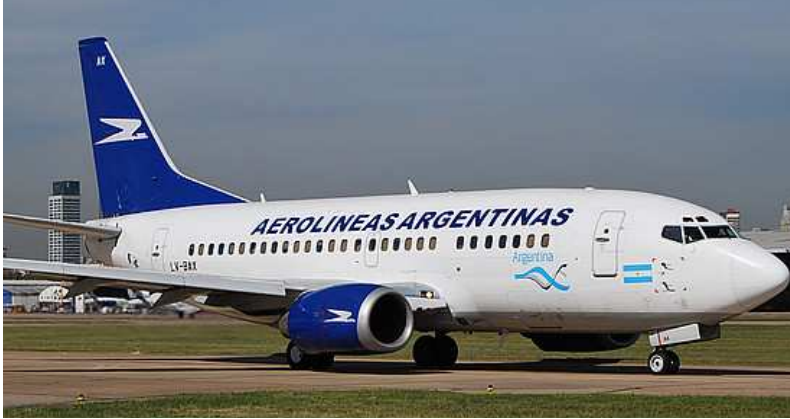
En los aviones de AA