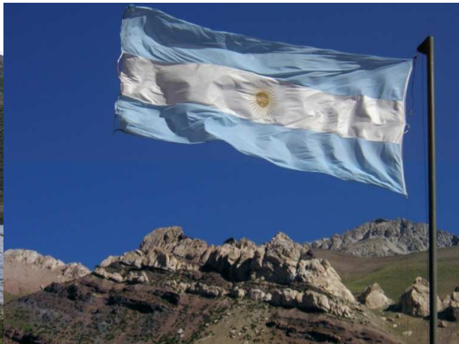
Cordillera de los Andes. Mendoza