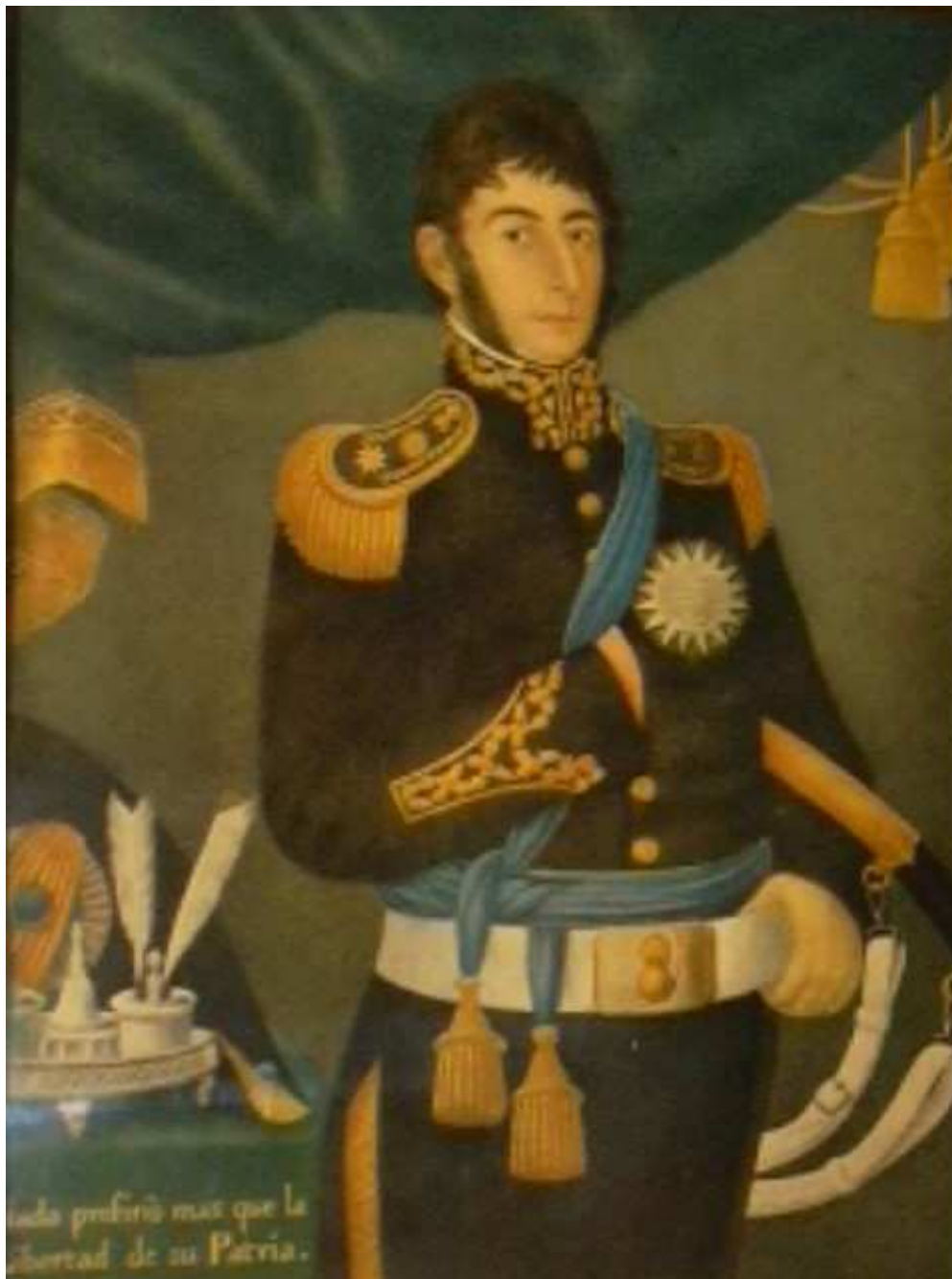
General José de San Martín (pintado por Gil de Castro, en 1820)