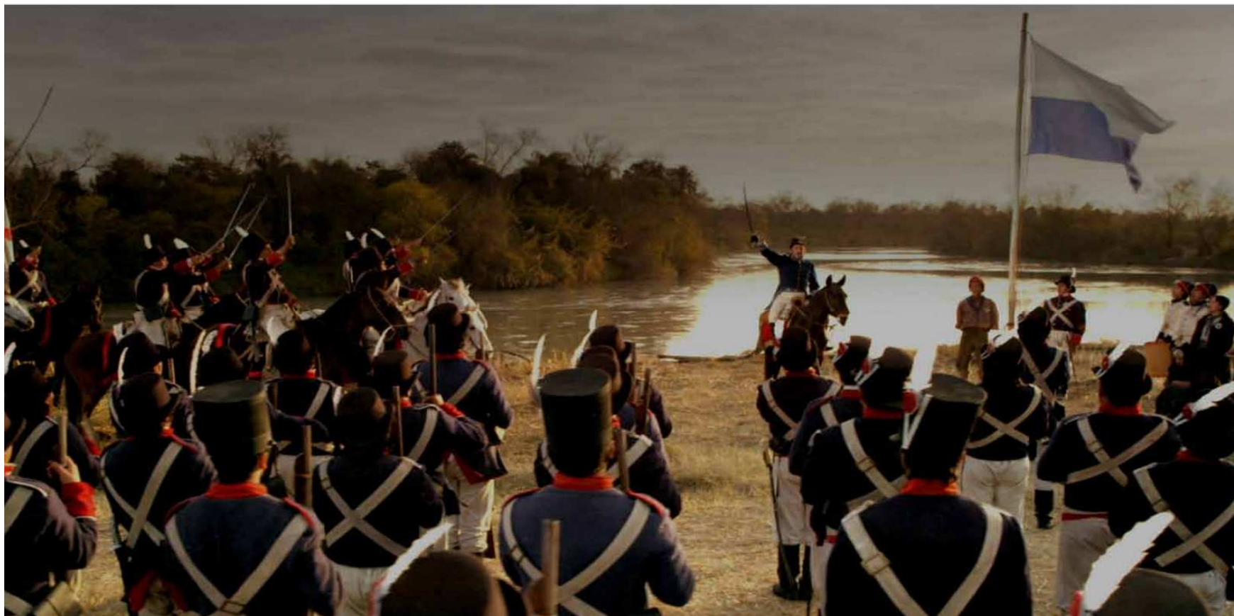
Jura de la Bandera, 12 de febrero de 1812. Fuente: Film "Belgrano". Sebastián Pivotto. 2010. Producción: TV Pública. Canal Encuentro. Unidad Bicentenario