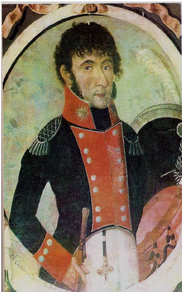
Francisco Ortiz de Ocampo luchó contra las tropas inglesas durante la segunda invasión de 1807 y en 1810 fue jefe de una expedición al Alto Perú. Sobre estas líneas, retrato del militar.