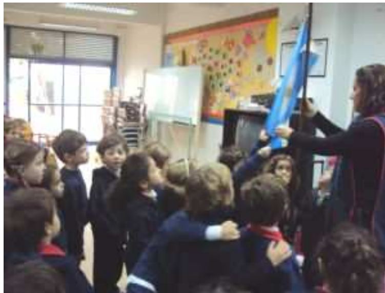
Jardín de Infantes zona urbana