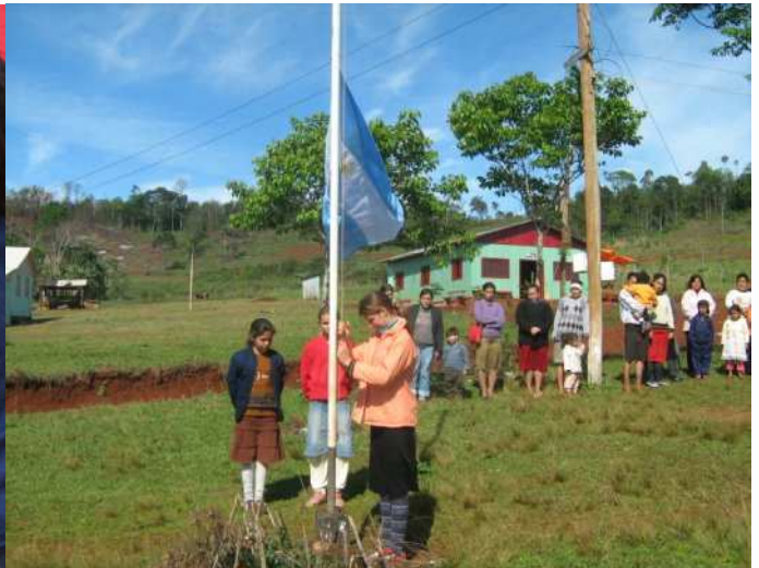
Aula Satélite N 269. Esc. 836. Misiones