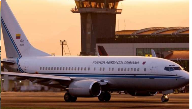
Avión República de Colombia