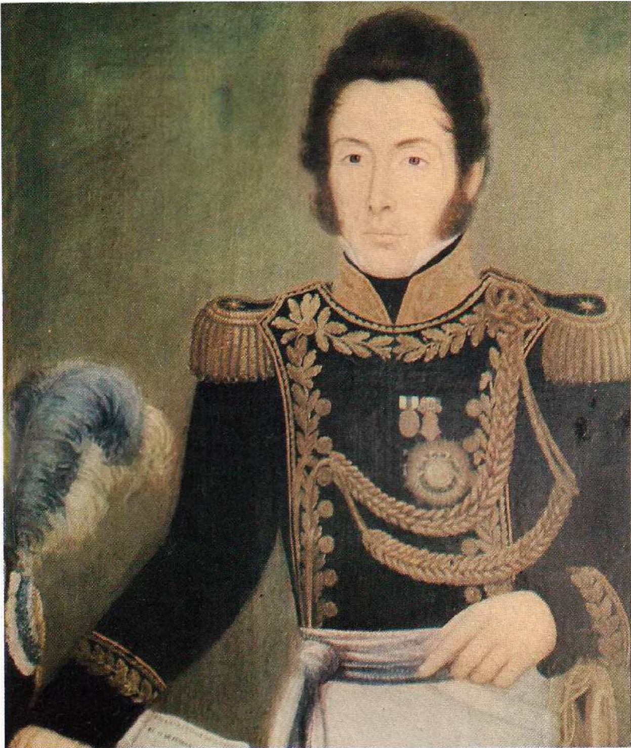
General Miguel Estanislao Soler, de destacada actuación en el Ejército de los Andes