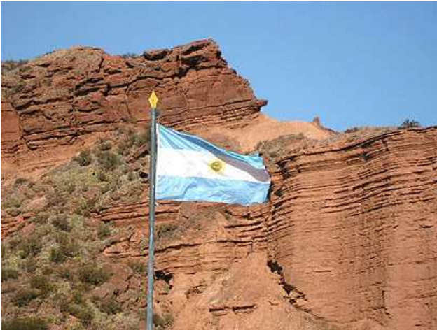
Las Quijadas. San Luis