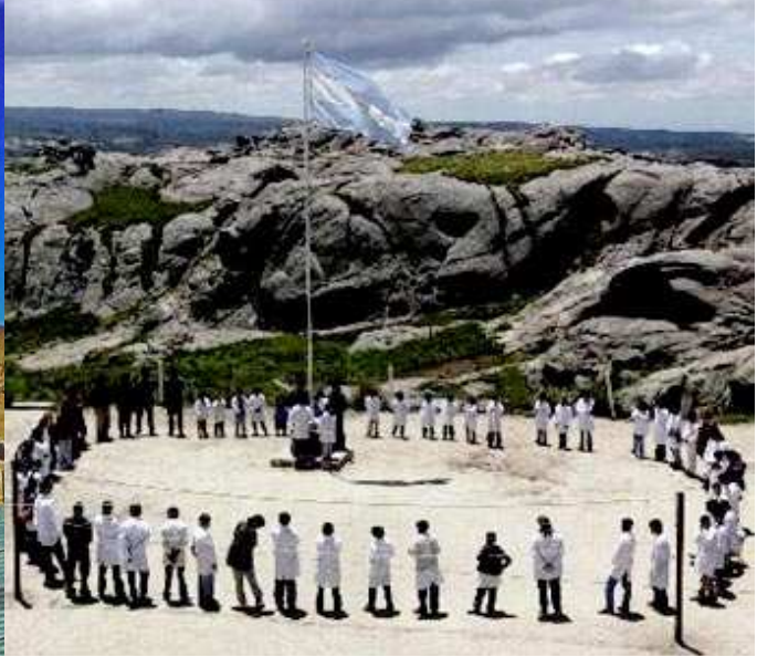
Escuela rural Ceferino.. Altas Cumbres cordobesas