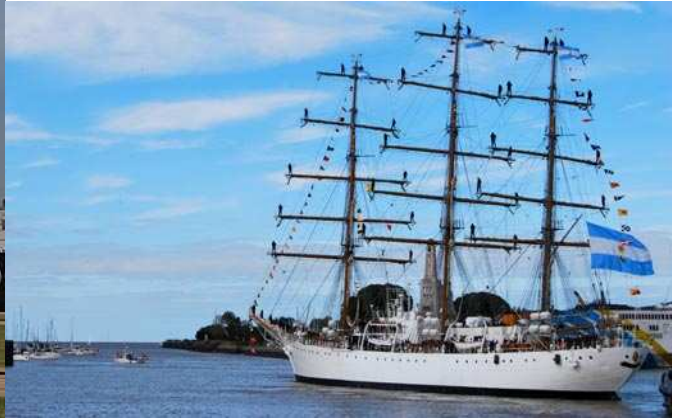
En los barcos