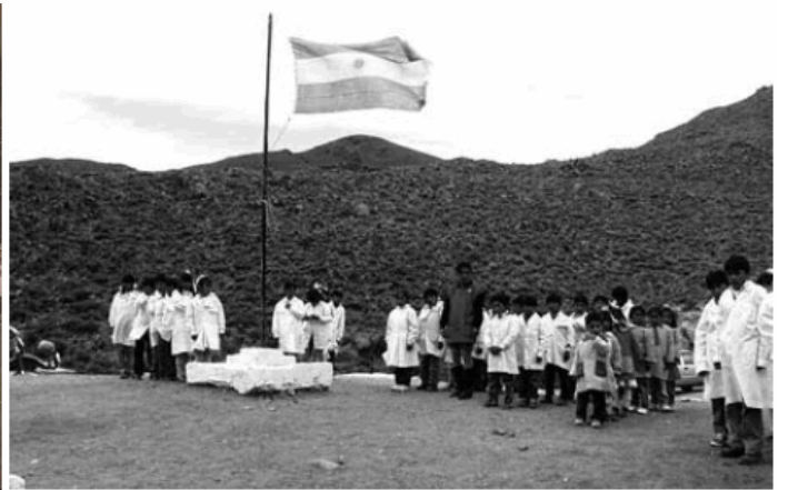
Escuelas en la época de los abuelos