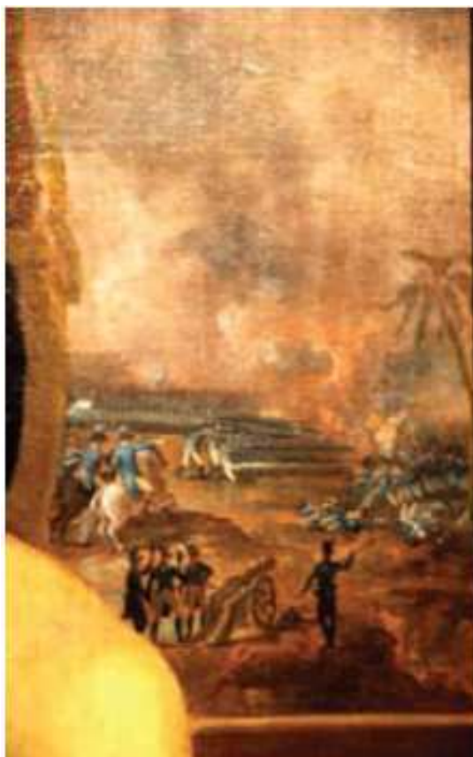
Detalle de la Batalla de Salta, en el Retrato de Carbonnier (se observan banderas blancas y celestes)