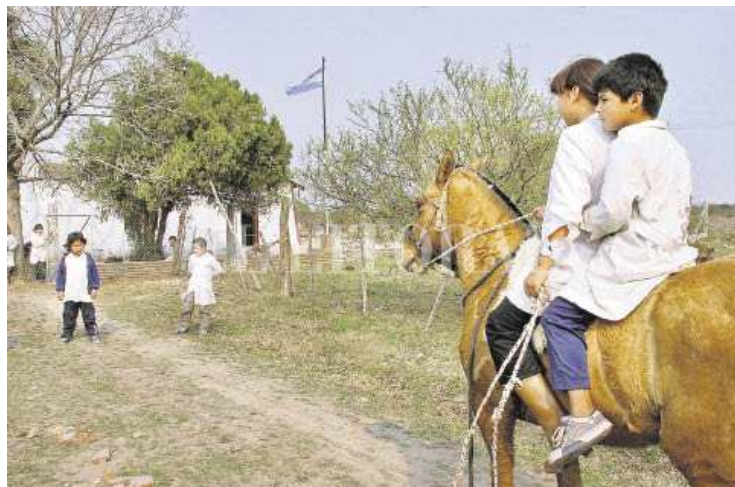
Escuela rural. Sin más datos.