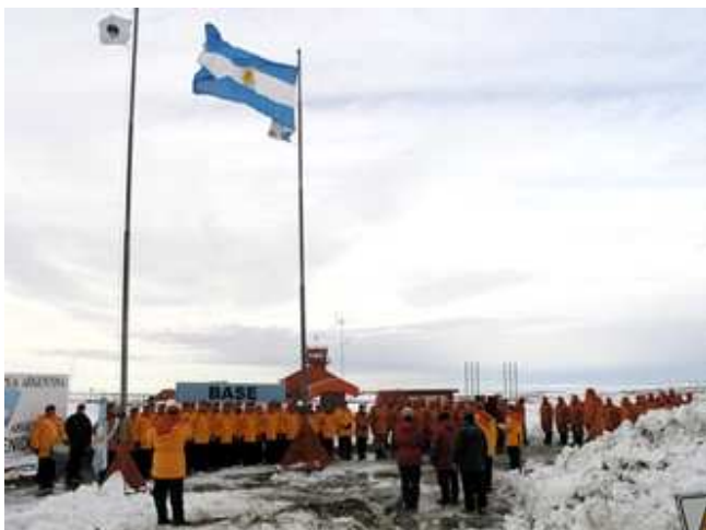
Base Marambio, Antártida Argentina