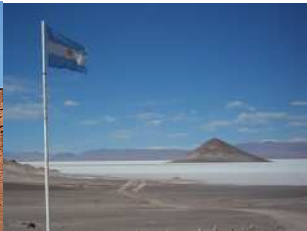
Salinas de Jujuy