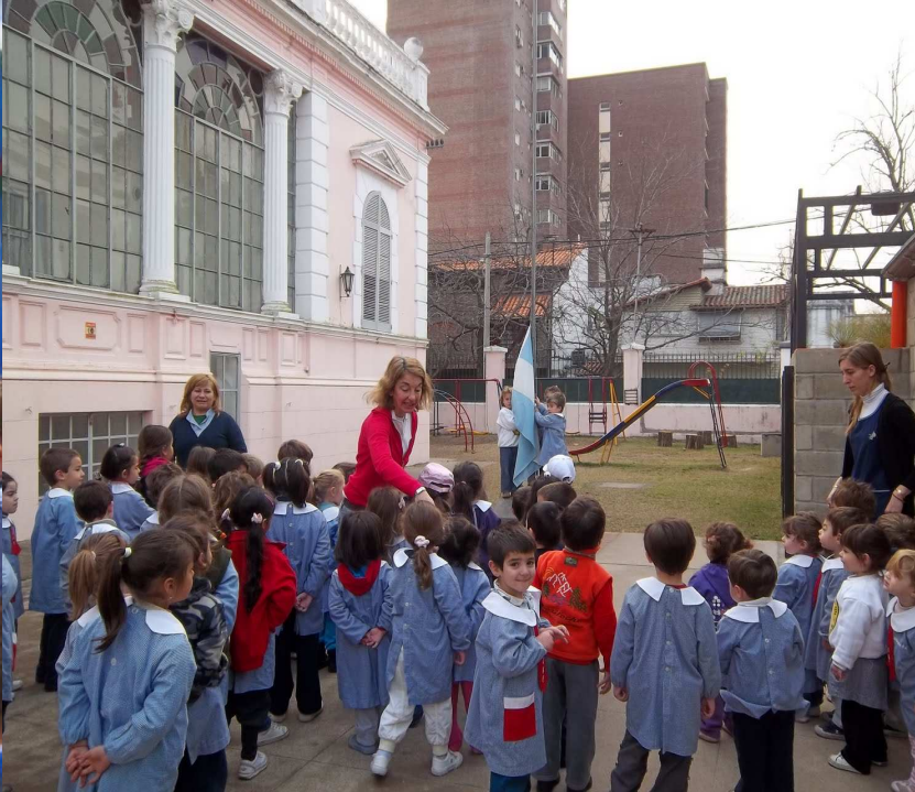
Jardín de Infantes N°1274. Ciudad de Santa Fe