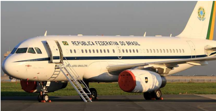
Avión República de Brasil