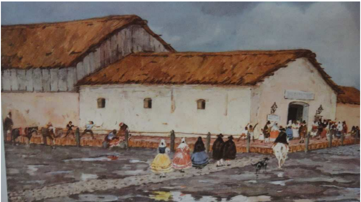
Teatro La Ranchería, Leonis Mathies. “Este cuadro nos muestra el teatro de La Ranchería en detalle, con su techo de paja, sus paredes de adobe y las damas desplazándose por el empedrado, bajo la luz de faroles con vela de sebo, que alumbraban su andar”. En: Grossman, M. Vaivenes del teatro rioplatense desde la conquista hasta 1810. Pág. 3.