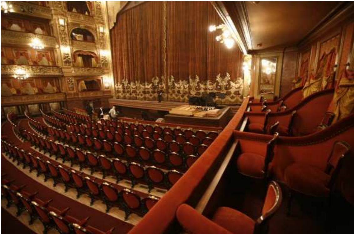
Teatro Colón. Buenos Aires

25 de mayo: Primer Gobierno Patrio, DGCyE