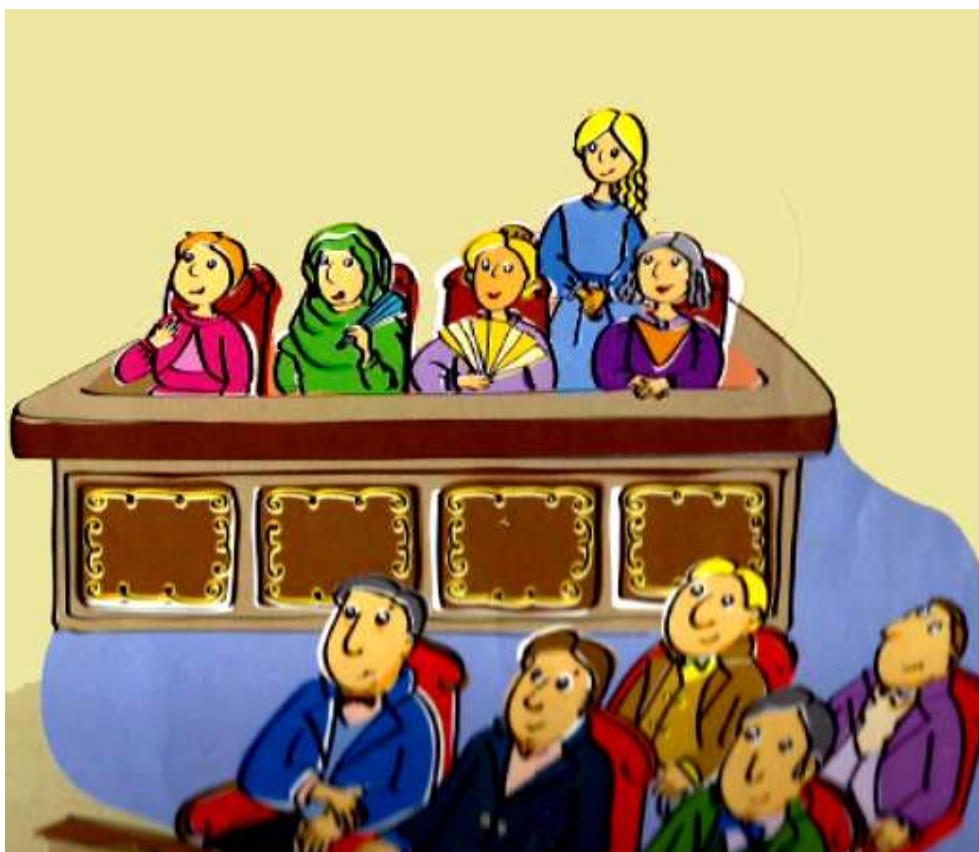
Ilustración de sala del Teatro “La Ranchería”. Ilustración de Maia Miller- Silvia Taborda. En: “Buenos Aires increíble. La ciudad criolla”. Pág.47. Podemos apreciar algunas normas del teatro de aquella época: mujeres en los palcos, hombres en las plateas.