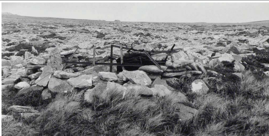
Monte Tumbledown. Posiciones argentinas.